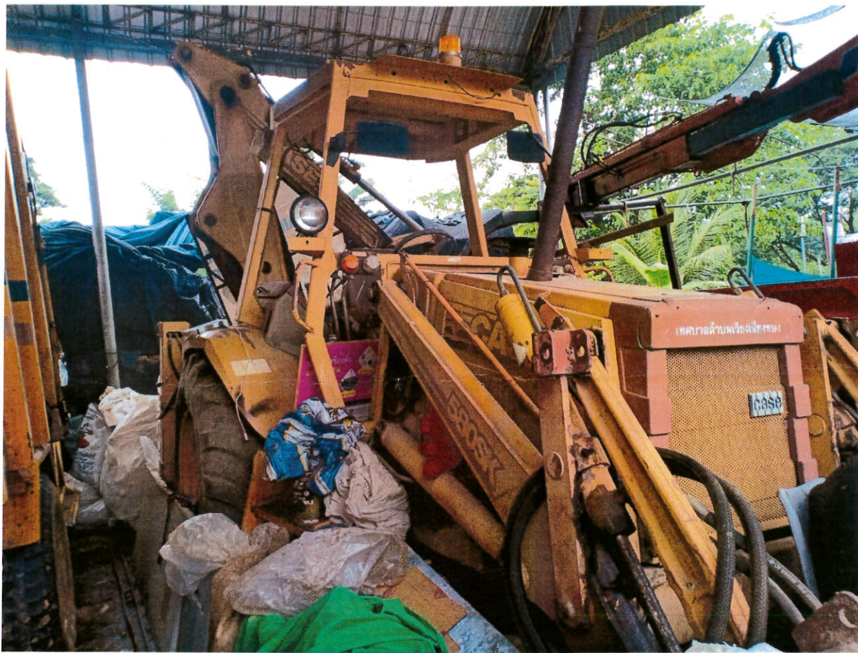
๒. รถยนต์บรรทุกส่วนบุคคล หมายเลขทะเบียน บท ๒๓๖