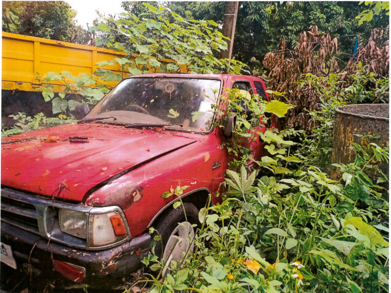
๓.รถบรรทุกขยะ แบบบอเนกประสงค์ ขนาด ๑๕๐ แรงม้า สีเหลือง ยี่ห้อฮิโน่ หมายเลขทะเบียน บ-๒๑๔๔ เชียงราย